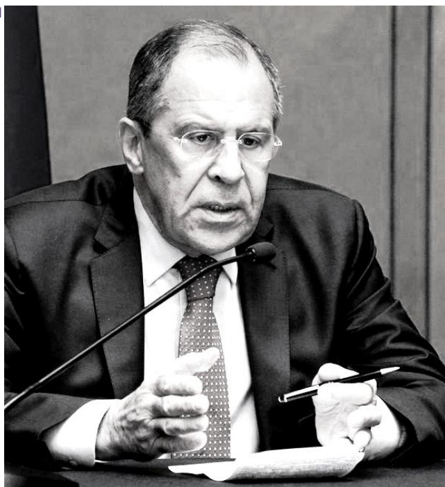
Министр иностранных дел России Сергей Лавров