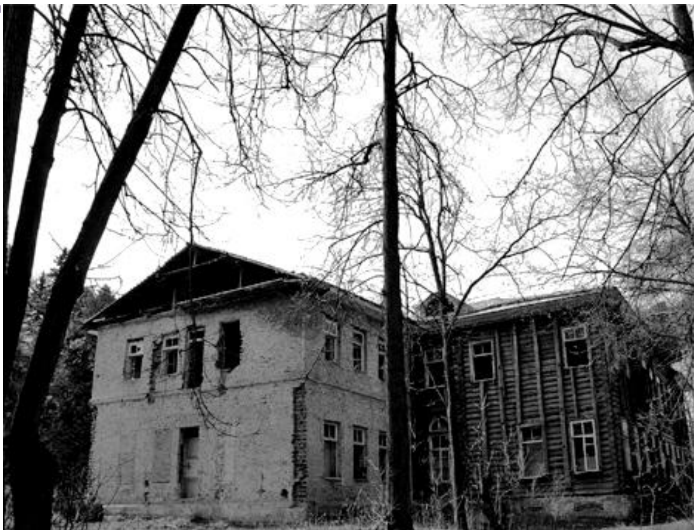
Усадьба "Измалково": пустые глазницы культуры...