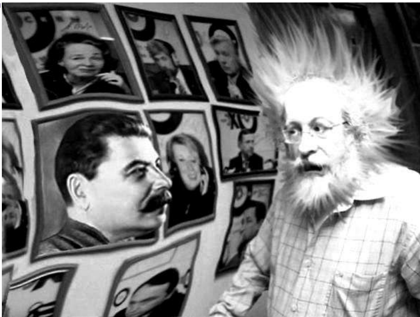
Алексей Венедиктов: неожиданности случаются...