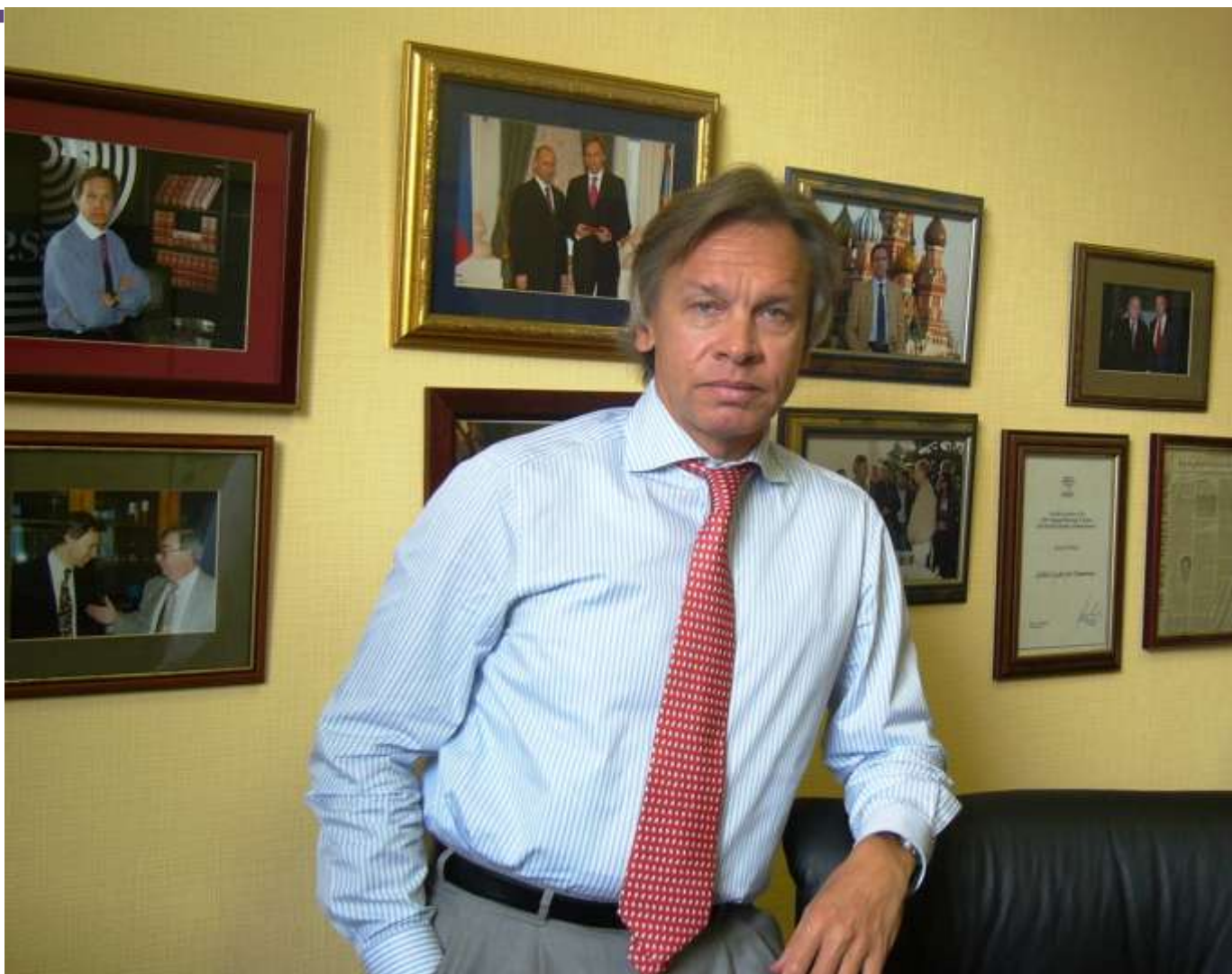
Алексей Пушков , председатель Комитета Госдумы по международным делам